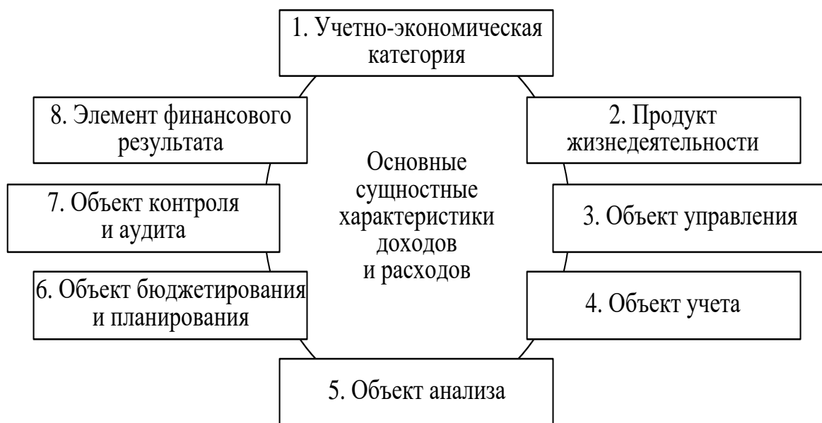
Рисунок 3 – Основные существенные характеристики доходов и расходов на предприятиях торговли

Дефиниции доходов и расходов – это учетно-экономические категории, которые являются значимыми на предприятиях торговли, при этом имеются различные варианты понимания экономического содержания и их роли в учетно-аналитическом обеспечении. На рисунке 3 представлены основные существенные особенности данных дефиниций.