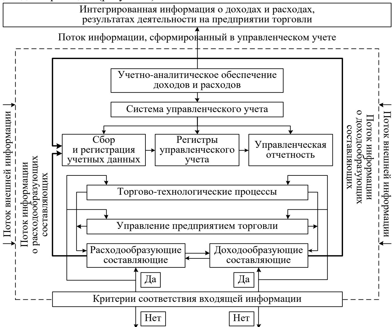
Рисунок 5 – Структурно-логическая модель развития методики управленческого учета доходов и расходов

Научная проработка вопросов современного управленческого учета способствует развитию наиболее прогрессивной методики управленческого учета доходов и расходов на предприятиях торговли, что представлено в структурно-логической модели развития методики управленческого учета доходов и расходов (рисунок 5).