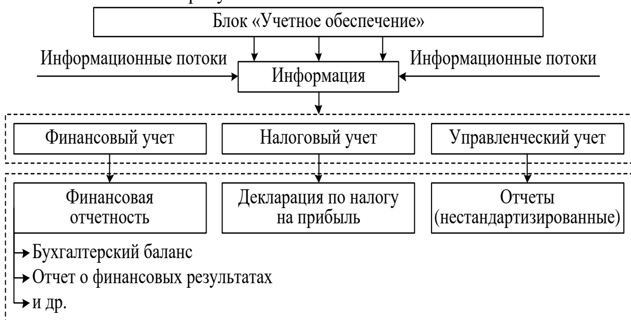
Рисунок 1 – Структура блока «Учетное обеспечение»

Представленная трактовка расширяет теоретические положения о сущности и экономическом содержании понятия «учетно-аналитическое обеспечение», что определяет значимость сформированной информации для целей управления на предприятиях торговли. В состав структуры учетно-аналитического обеспечения доходов и расходов на предприятиях торговли, состоит из двух блоков. Первый блок «Учетное обеспечение» способствует формированию различной информации, позволяющей всесторонне судить о доходах, расходах и финансовых результатах. Схематично состав блока «Учетное обеспечение» рисунке 1.