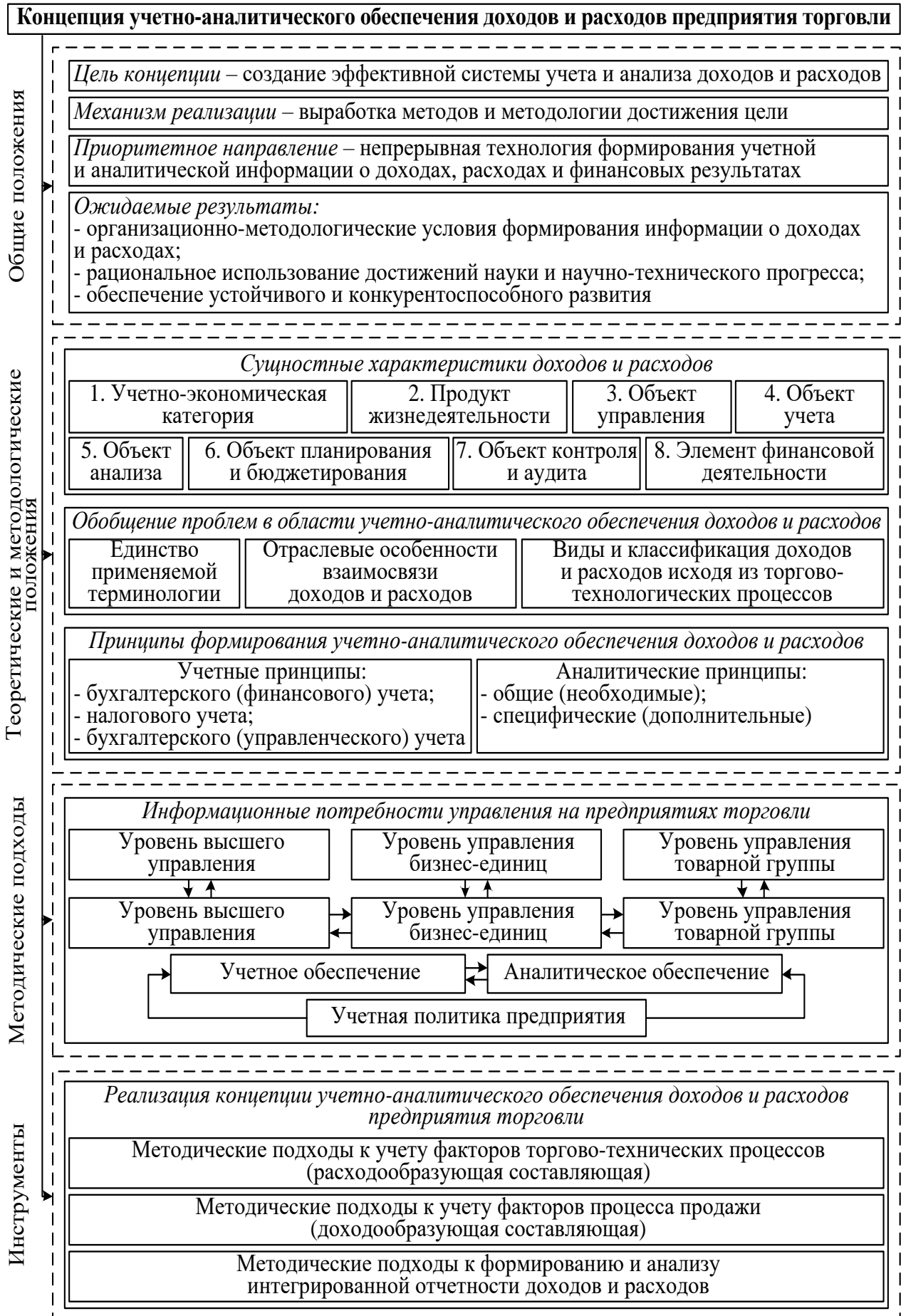
Рисунок 4 – Концепция формирования учетно-аналитического обеспечения доходов и расходов на предприятиях торговли