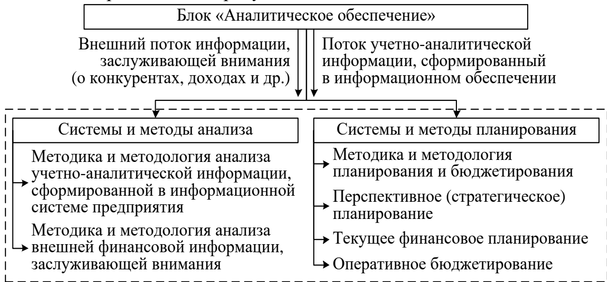
Рисунок 2 – Структура блока «Аналитическое обеспечение»

Второй блок «Аналитическое обеспечение» обладает свойством репрезентативности, что заключается в способности оценки информации, сформированной в учетном обеспечении. Схематично блок «Аналитическое обеспечение» представлен на рисунке 2.