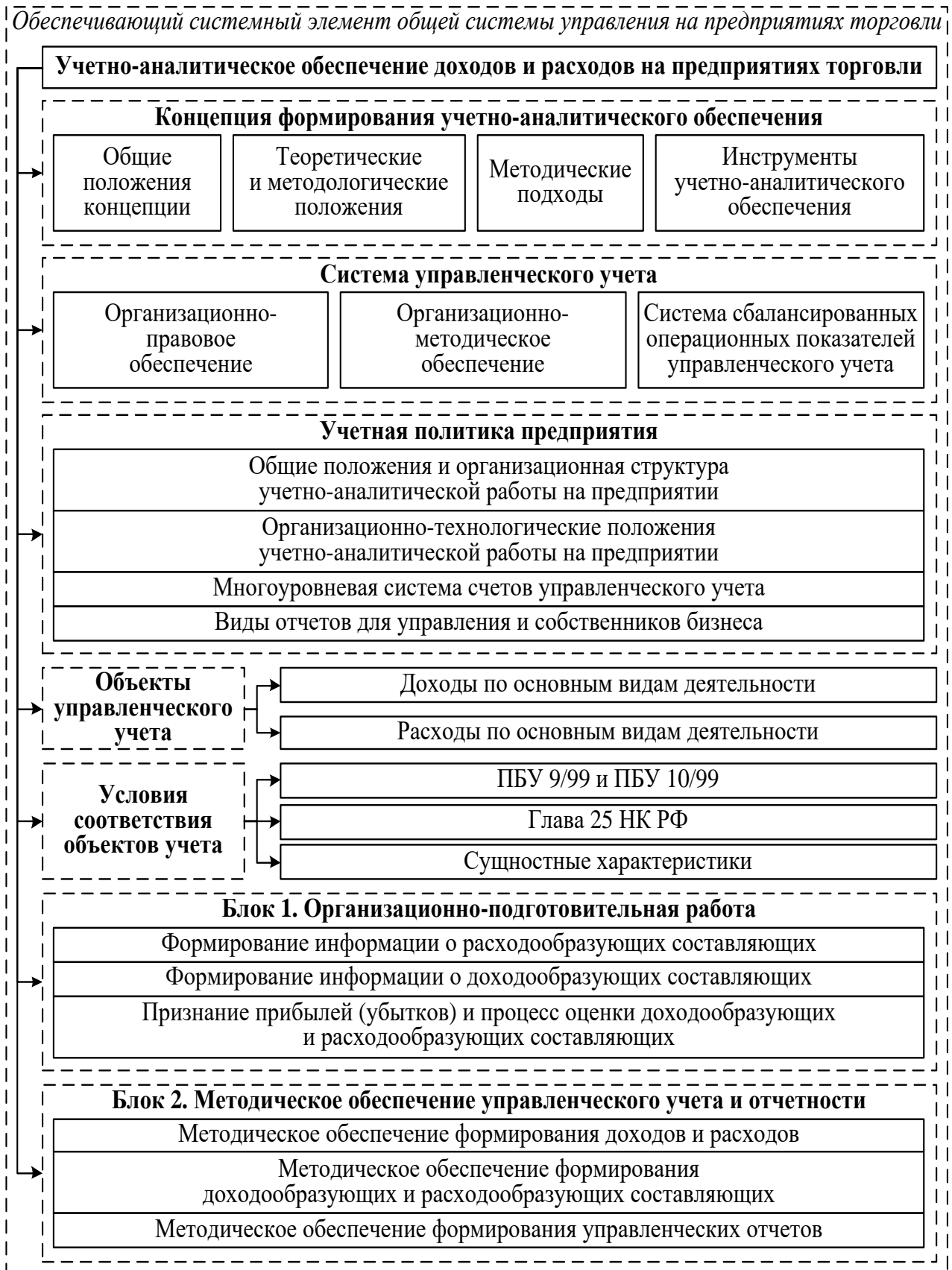
Рисунок 7 – Функциональная модель структурных элементов концепции учетно-аналитического обеспечения доходов и расходов

информации о доходобразующих составляющих по видам товаров с учетом концепции жизненного цикла; признание прибылей (убытков) по итогам сопоставления доходобразующих и расходобразующих составляющих и процесс оценки доходобразующих и расходобразующих составляющих.