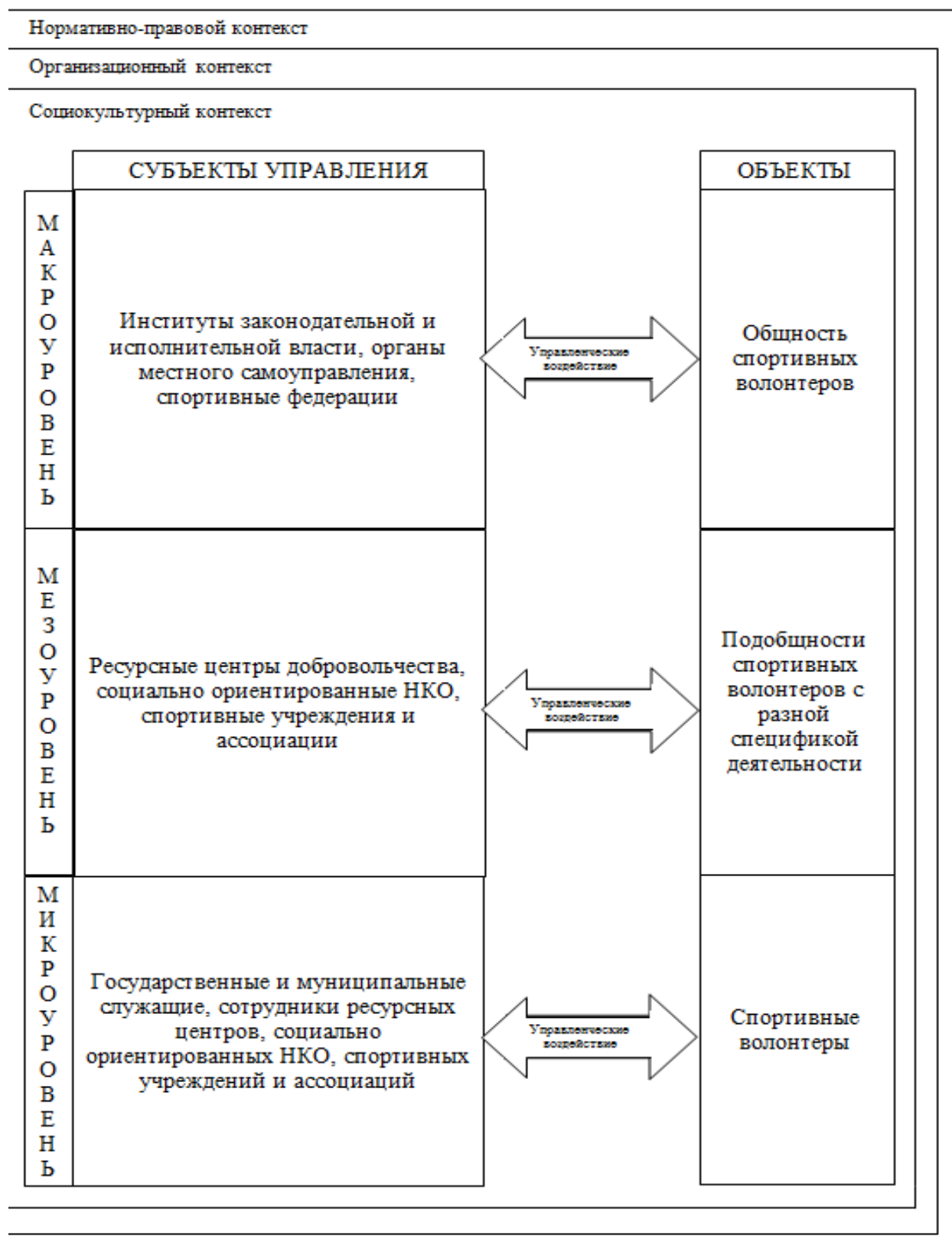
Рис. 2. Модель исследования управления спортивным волонтерством

Разработана модель исследования управления спортивным волонтерством (рис. 2). На трех уровнях функционирования институциональных норм активны разные институциональные субъекты управления спортивным волонтерством.