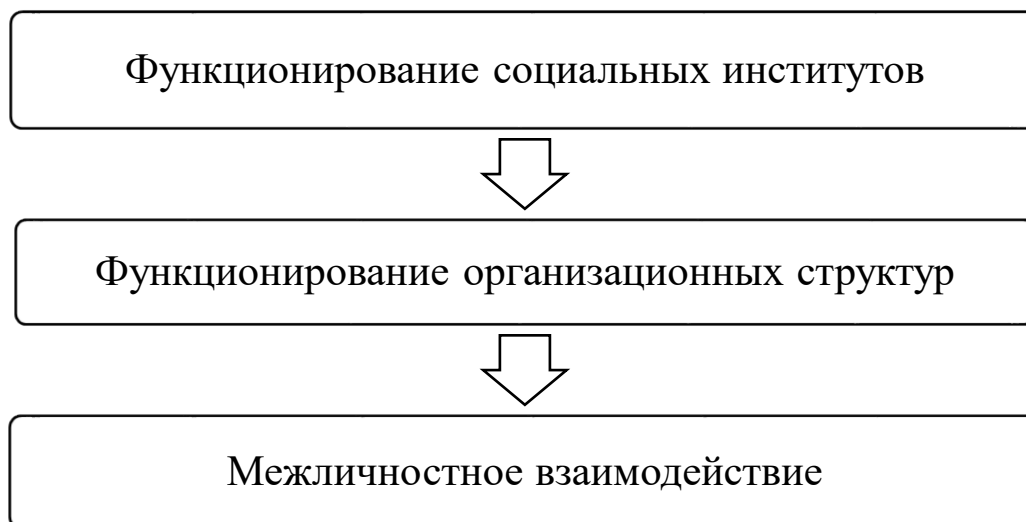
Рис. 1. Уровни формирования институциональных норм в управлении спортивным волонтерством

В теоретической модели исследования управления спортивным волонтерством в сопряжении с его институциональными функциями выделяется три уровня выявления формальных и неформальных норм, определяющих развитие спортивного волонтерства (рис. 1).