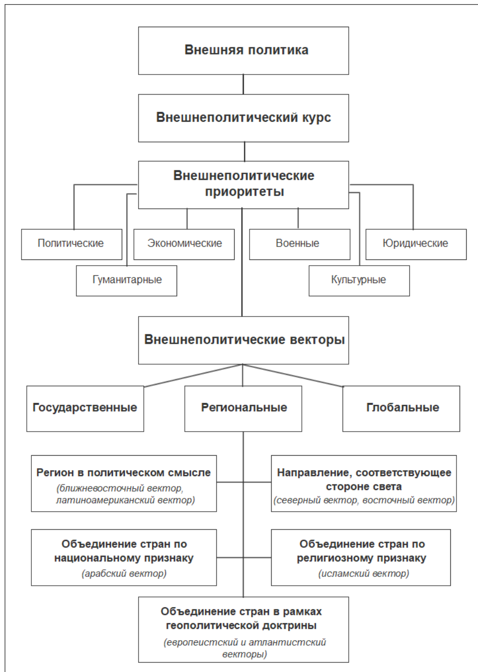
Рисунок 2. – Иерархия и классификация понятий, применяемых при анализе внешней политики

Определенная субъектом в качестве внешнеполитического вектора территория должна представлять для него какую-либо ценность. Среди всех факторов, обуславливающих эту ценность, в качестве наиболее значимых можно выделить три: